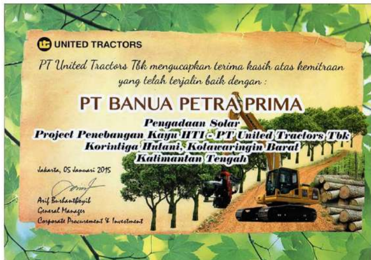
Kemitraan Bersama United Tractors dalam project Penebangan Kayu HTI - PT United Tractor Tbk Korintiga Hutani, Kotawaringin Barat Kalimantan Tengah