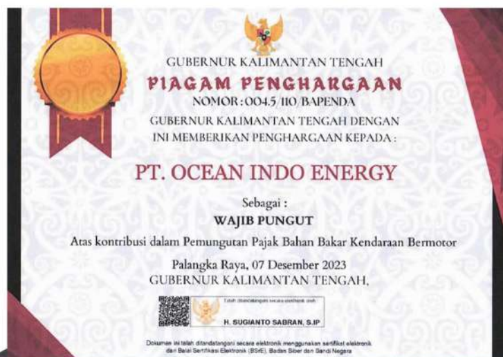
Piagam Penghargaan PT. Ocean Indonesia Energy sebagai "WAJIB PUNGUT" No: 004.5/110/BAPENDA dari Gubernur Kalimantan Tengah.