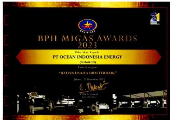
Badan Usaha Migas Terbaik (III) di BPH MIGAS AWARDS 2023